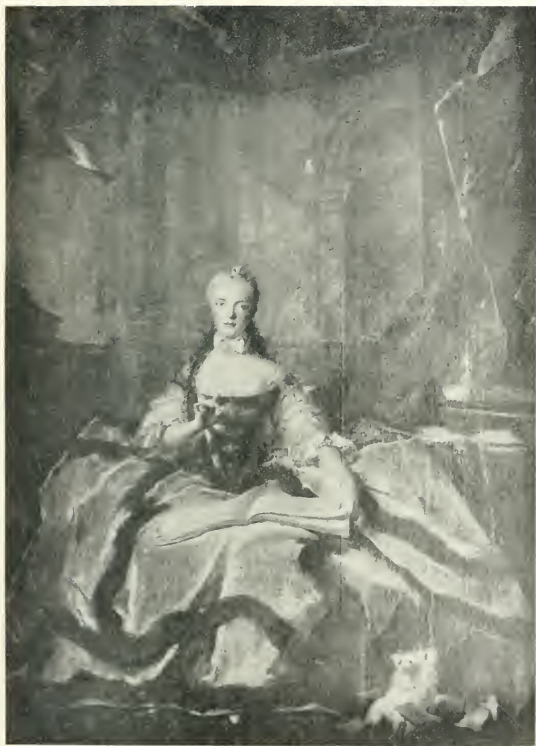
MADAME ADÉLAÏDE, FILLE DE LOUIS XV